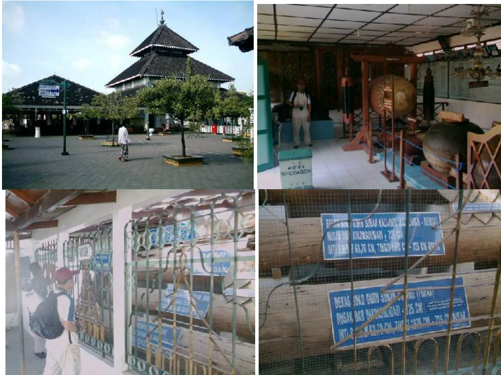
Gambar 2: Beberapa usaha dokumentasi yang dilakukan pada Masjid Demak untuk memperjelaskan sejarah dan perkembangan masjid bersejarah ini.