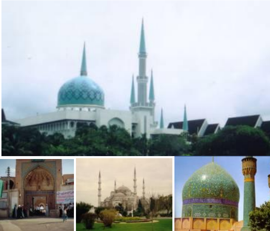
Gambar 4: Masjid Universiti Teknologi Malaysia dengan elemen-elemen yang ditiru : Gerbang Iwan di Iran, Menara daripada Blue Mosque di Turki dan Kubah daripada Masjid-i Shah di Isfahan.