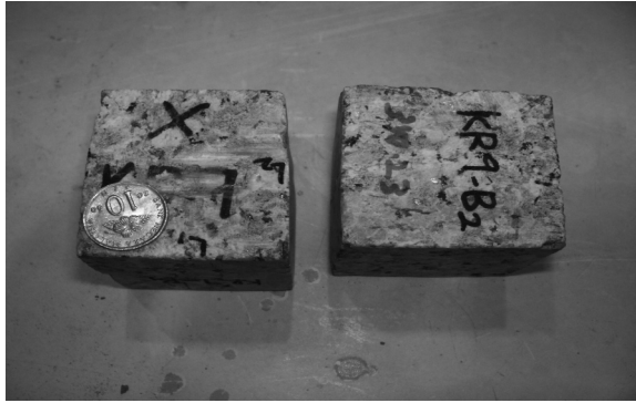
RAJAH 2. Sampel batuan untuk ujian ricih terus