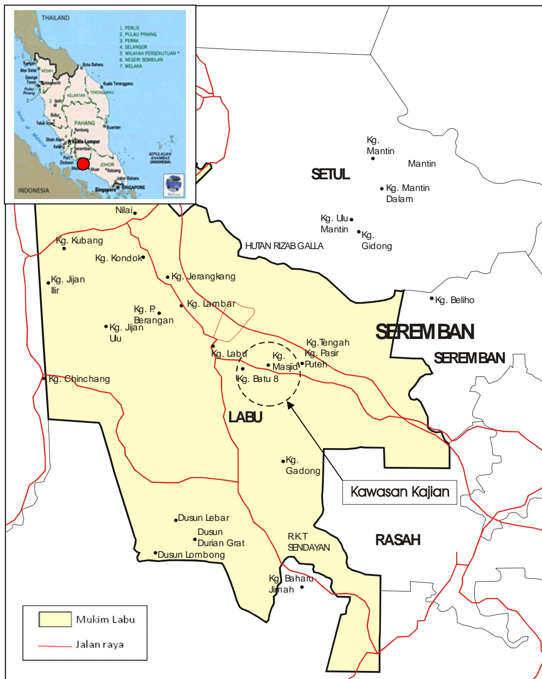
Rajah 1: Kawasan Kajian