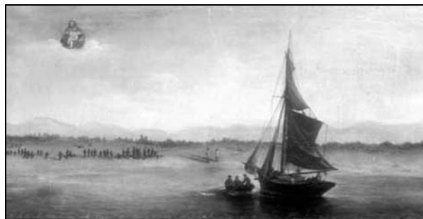
Slika 3. Kuter Jessie pri spašavanju brodolomaca, Ivanković, Gospa od Milosrđa, Dubrovnik

Charles Tuckey iz Manduraha pronašao i pomogao im oporaviti se. Doplovio je svojim kuterom Jessie (danas na zavjetnoj slici), kojim je pošao u lov na bisere.