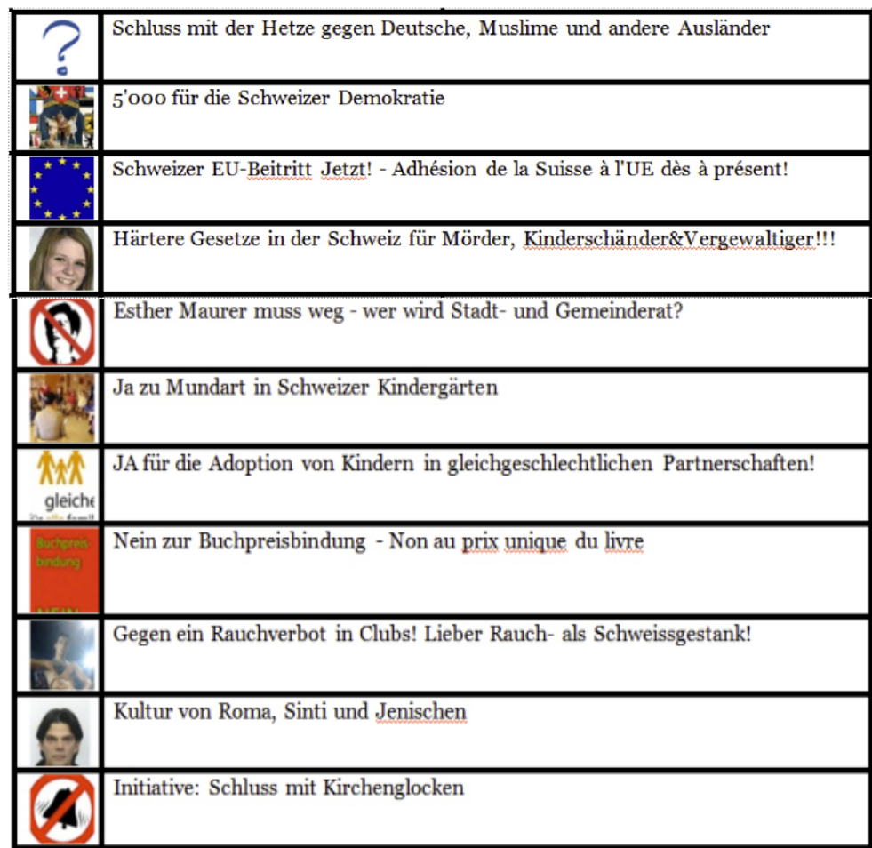
Abb. 2: Übersicht über die befragten Facebook-Gruppen.

Gründer wurden mit der Bitte angeschrieben, sich an der Umfrage zu beteiligen; ebenso wurde eine entsprechende Aufforderung an die Pinnwand der jeweiligen Gruppe geschrieben. Bei der Auswahl dieser Gruppen legten wir Wert darauf, ein breites politisches Interessenspektrum aufzugreifen – sowohl «linke» wie «rechte» Anliegen, aber auch solche, die politisch nicht so leicht zuzuordnen sind (Rauchverbot in Clubs, Buchpreisbindung, Schluss mit Kirchenglocken etc.). Dabei wurden Themen, die zum Zeitpunkt der Umfrage auf der offiziellen Agenda von Parteien standen und im öffentlichen politischen Diskurs verhandelt wurden (z. B. Migrationsfragen, EU-Beitritt, Mundart im Kindergarten etc.), ebenso berücksichtigt, wie «Lifestyle»-Themen, die in der offiziellen Politik wenig Resonanz hatten (Schluss mit Kirchenglocken oder gegen ein Rauchverbot in Clubs). Die Mitglieder folgender Gruppen erhielten die Aufforderung, einen Online-Fragebogen auszufüllen: