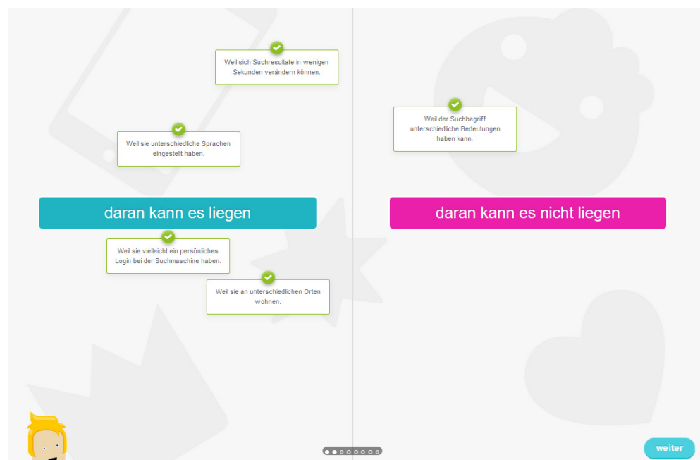
Abb. 2: Auswertung einer dichotomen Entscheidungsfrage: Woran kann es liegen, dass Suchanfragen in einer Suchmaschine bei verschiedenen Personen zu unterschiedlichen Ergebnissen führen?

Die Fragen des Medienprofis-Tests wurden in einem ersten Schritt von einem Team des Instituts für Medien und Schule der Pädagogischen Hochschule Schwyz entlang des Themenrasters in Tabelle 1 entworfen. Zu jedem der aufgeführten Unterthemen wurde ein Fragenblock aus drei bis zwölf Items entwickelt, so dass der gesamte Test bei einer anvisierten Länge von 10 Fragen typischerweise mehr als fünfzig Items umfasst. Insgesamt wurden somit rund 250 Fragen entwickelt. Dabei gab es fünf unterschiedliche Fragetypen: Entscheidungsfragen mit dichotomen Optionen (z. B. stimmt/stimmt nicht), Einschätzfragen mit mehrfachen Optionen (z. B. stimmt/stimmt teilweise/stimmt nicht), Paarzuordnungen («Ziehe die passenden Begriffe/Abbildungen zusammen»), Bildung von Rangreihen («Ordne die Elemente nach ihrer Dateigröße») sowie Einordnungen auf einem Zahlen- oder Zeitstrahl («Wann wurden folgende Medien erfunden?»). Grafisch wurden die Fragen in einer Lernkartenmetapher gestaltet, wobei sich die Karten per Drag und Drop auf dem Bildschirm an den korrekten Ort verschieben lassen, was insbesondere auf Touchscreens intuitiv ist (Abb. 2).