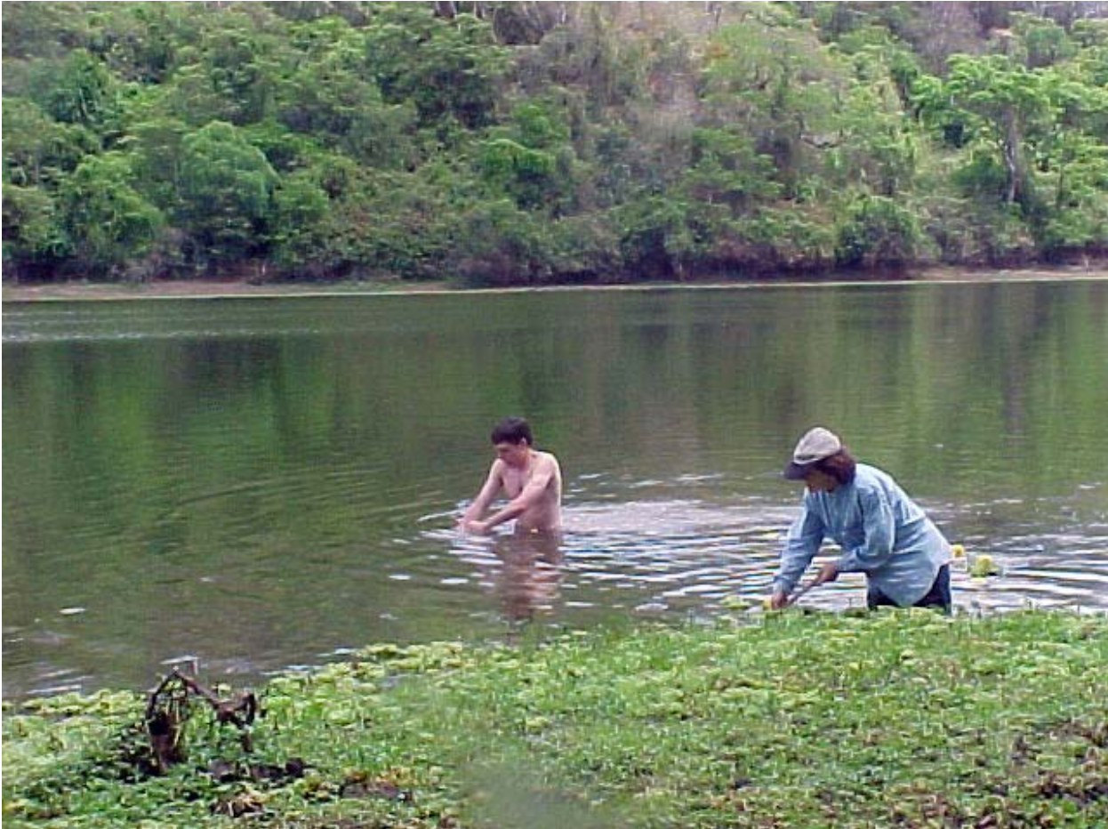
Toma de muestras en el río Juramento, 2007