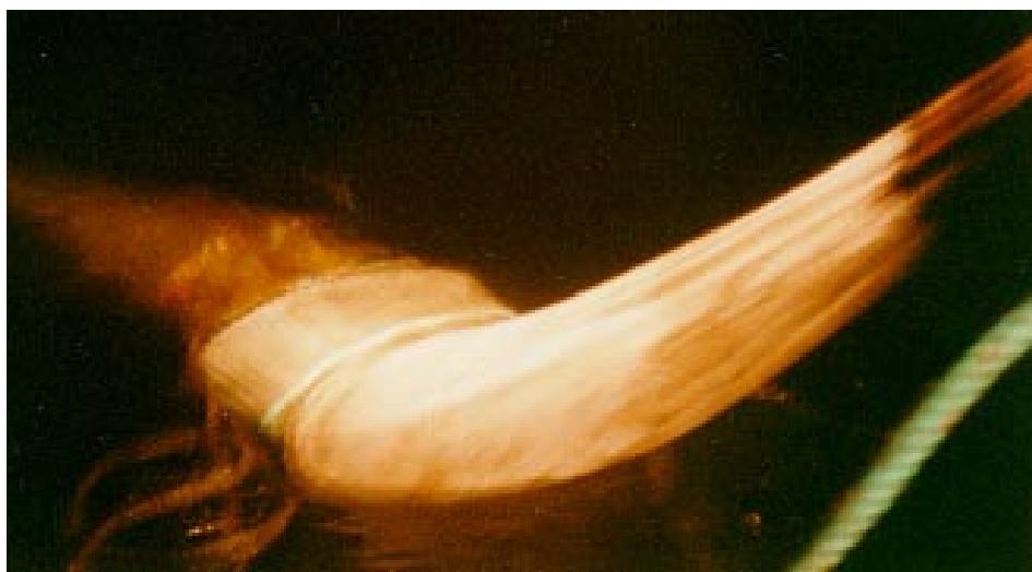
Abb. 4: Flexibles Heringssortiergitter RESR6 beim Aussetzen Flexible herring sorting grid RESR6 during shooting

Ob sich die Kegelform des Gitters genau so wie gewünscht einstellt, können nur Unterwasserbeobachtungen bestätigen. Vorerst läßt lediglich das Verhalten des flexiblen Gitters beim Aussetzen und Hieven – die Gummipreiszringe halten den Gitterkegel in gleichmäßiger elliptischer Form offen – auf eine auch beim Schleppen funktionsgerechte Form schließen (Abb. 4). Eine selektierende Wirkung des Gitters tritt offenbar ein, wie dem Vergleich der Längenzusammensetzungen aus den Fangmengen von Versuchs- und Vergleichshol im Holpaar 1 zu entnehmen ist (Abb. 5). Diese Tendenz konnte nicht durch weitere Holpaare bestätigt werden, weil das Netztuch der Selektionsvorrichtung nach dem zweiten Versuchshol an mehreren Stellen zerrissen war. Infolge der Beschädigung war der vordere Gummiring zusammengefallen und das Gitter in seiner Wirkung stark beeinträchtigt.