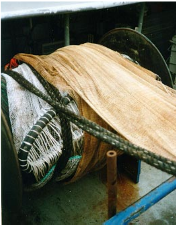
Abb. 3: Flexibles Heringssortiergitter RESR6 auf der Netztrommel

Flexible herring sorting grid RESR6 on the net drum