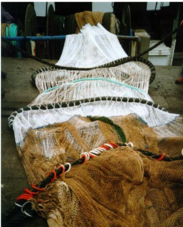
Abb. 2: Flexibles Heringsselektionsgitter RESR6 vor der Netztrommel des Kutters SH 10 Flexible herring sorting grid RESR6 in front of net drum

Da die Abmessungen des Steertes bei der Versuchsfischerei größer als die üblichen Netze waren, mußte nach einer völlig neuen Lösung für eine Selektionsvorrichtung gesucht werden, denn die bekannten starren Gitter hätten weder die erforderliche Fläche aufweisen noch die Handhabbarkeit im Fischereiprozeß gewährleisten können. In Anlehnung an eigene Erfahrungen, die schon mit einer flexiblen Selektionsvorrichtung für Dorsch vorlagen (Gabriel et al. 1999) und an die vom norwegischen Fischereiforschungsinstitut in Trondheim entwickelte Radial Escape Section (Valdemarsen 1986) wurde ein kreisrundes flexibles Selektionsgitter entworfen und gebaut (Abb. 1). Es besteht aus 260 Stück Polyesterschnüren von 5 mm Durchmesser und hat die Form eines Kegelstumpfmantels mit einem Eingangsdurchmesser von 1,9 m. Es erhält seine Form beim Schleppen im Wasser durch die Zugkräfte des Steerts und durch die Spreizwirkung von zwei Ringen aus Profilgummi.