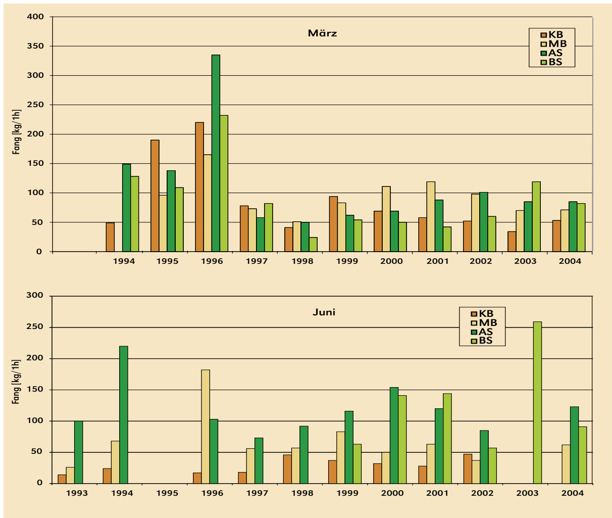
Abbildung 2: Einheitsfänge Dorsch (kg/1h) nach Gebieten und Jahren des FFK Solea für die Monate März und Juni. CPUE cod (kg/1h) by areas and years of FRV Solea for the months march and june.

Ostsee (Beltsee) mit der Mecklenburger Bucht und der Kieler Bucht (Abb. 1). Die den Analysen zugrunde liegenden Datenserien wurden zwischen 1993 und 2003 auf speziellen Surveys zur Reproduktionsbiologie von Dorschen der Ostsee gewonnen. Diese Surveys fanden in der Beltsee jährlich jeweils in den Monaten Januar, Februar, März, Mai und Juni, November und Dezember statt. In der Arkonasee und in der Bornholmsee erfolgten die Arbeiten jeweils im März und im Juni (Tab. 1).