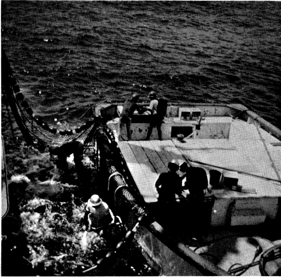
FIGURE 1. Tagging in the skiff of a chartered purse seiner.