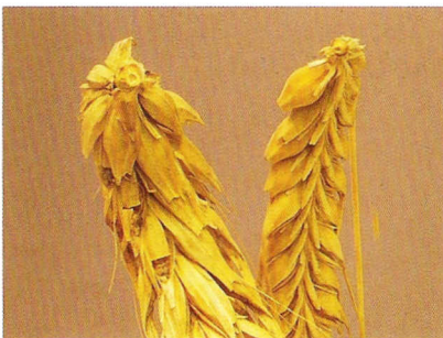
2 og 6 radet byg.

knækning. Sorten fik en del udbredelse, men efterhånden som bygavlen blev forbedret i Danmark og andre lande faldt merprisen for maltbyg af særlig høj kvalitet, og uden denne kunne sorten ikke konkurrere med Prentice.