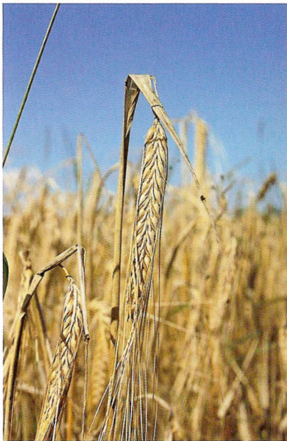
2 radet byg.