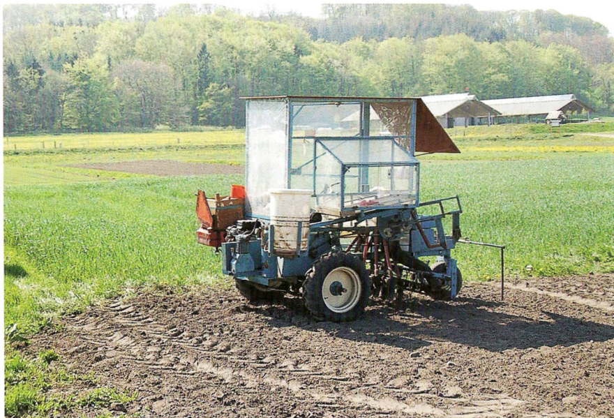
Landbrugsmuseet har stillet maskiner til rådighed til forsøgsmarkerne. En såmaskine og en mejetærsker.

For at bevare de gamle plantesorter er der over hele verden oprettet genbanker, hvor frø af planterne opbevares for eftertiden. Med jævne mellemrum tages frøene ud af genbanken for at blive dyrket og opformeret. På den måde bevares frøenes spireevne og der dyrkes nok frø til, at man kan få frø udleveret til forsøg og lignende. I et projekt, der gennemføres med støtte fra Landdistriktsprogrammet, har vi siden 2006 prøvedyrket en lang række af de gamle danske kornsorter, og vurderet deres dyrknings- og anvendelsesegenskaber. Dyrkningen foregår primært på Mørdrupgård på Sjælland, men foregår også andre steder, blandt andet på de histo-