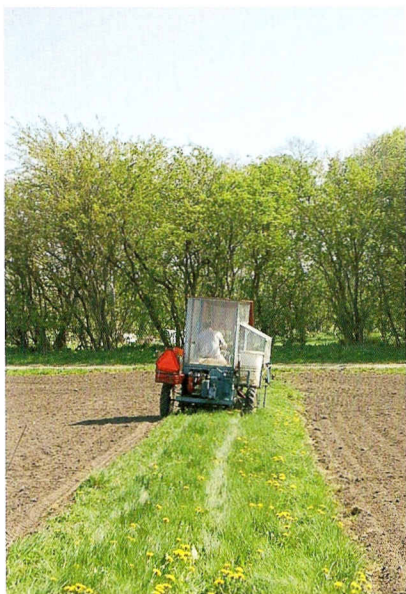
Såning på de små forsøgs-kornparceller.

jorde, hvor den udmærkedes sig ved nøjsomhed, og gav fortrinligt brødkorn.