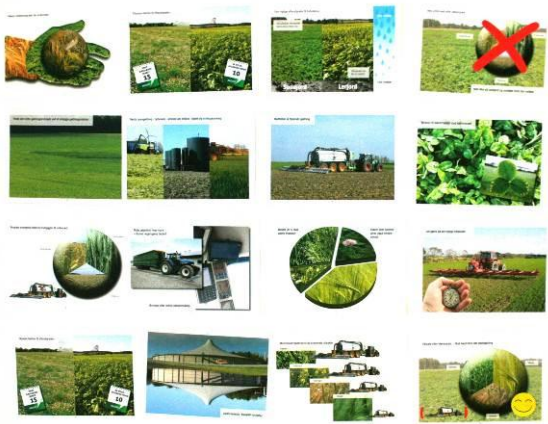
A: Faglige anbefalinger