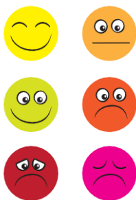
B: Kommentarkort – holdning