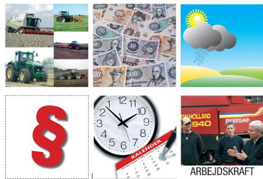
B: Kommentarkort – forhold