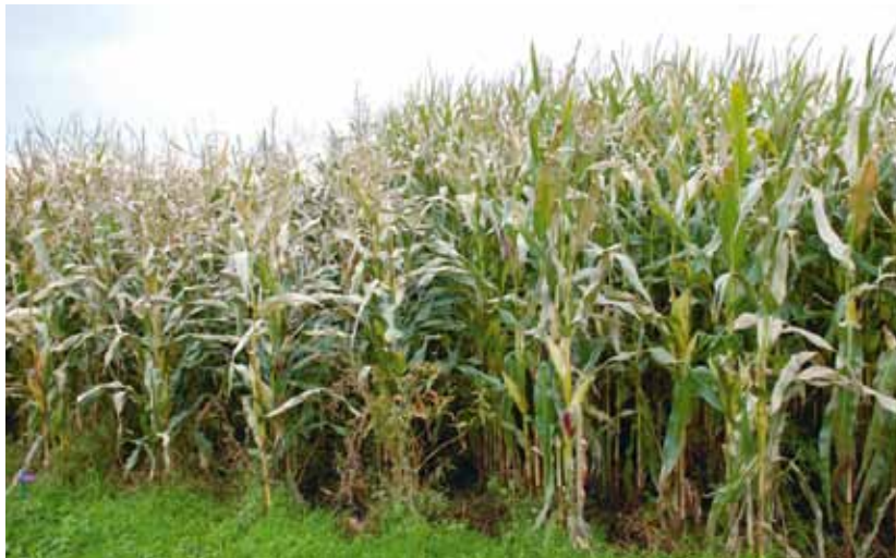
Auf dem Strickhof können alle wichtigen Maissorten verglichen werden. Links: Populationsorten, rechts: Hybridsorten.

Besucher am Ackerbautag aus erster Hand informieren wird. Hansueli Dierauer