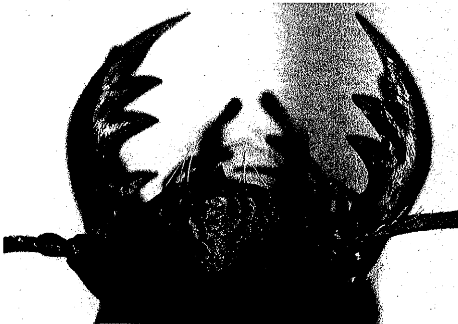
Abb. 3. Die Mundwerkzeuge des Sandlaufkäfers Cicindela campestris .

Abb. 2. Mögliche Zusammenhänge zwischen: Ökologischer Typ, Habitatbindung und Toleranz gegenüber Schwankungen von abiotischen Faktoren (Temperatur, Licht und Feuchtigkeit) bei den Laufkäfern. 1) Ausgesprochene Waldbewohner (WB), die stark auf Schwankungen von abiotischen Faktoren (AF) reagieren. 2) Ausgesprochene WB, die schwach auf Schwankungen von AF reagieren. 3) WB, die auch im Freiland zu finden sind und stark auf Schwankungen von AF reagieren. 4) WB, die auch im Freiland zu finden sind und schwach auf Schwankungen von AF reagieren. 5) Ausgesprochene Freilandbewohner (FB), die stark auf Schwankungen von AF reagieren. 6) Ausgesprochene FB, die schwach auf Schwankungen von AF reagieren. 7) FB, die auch in Wäldern zu finden sind und stark auf Schwankungen von AF reagieren. 8) FB, die auch in Wäldern zu finden sind und schwach auf Schwankungen von AF reagieren.