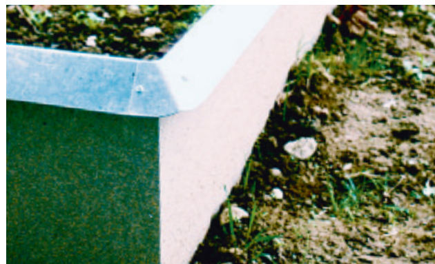
Für Gemüsegärten bietet ein richtig installierter Schneckenzaun guten Schutz.

Die Effektivität war in Versuchen bei hohem Schneckendruck mit Spanischen Wegschnecken geringer als bei konventionellen Schneckenkörnern auf der Basis von Metaldehyd. Die Aufwandmenge variiert je nach Produkt. Wo ein Dosierungsbereich angegeben ist, sollte die Dosierung an die Grösse und an die Häufigkeit der Schnecken angepasst werden.