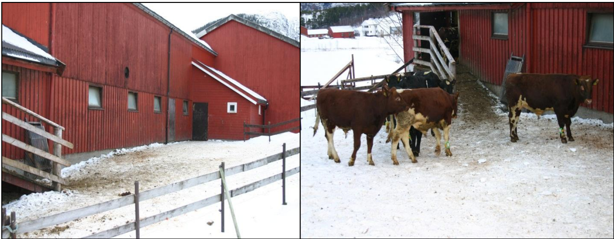
Fig. 1 Luftegård i besetning A.