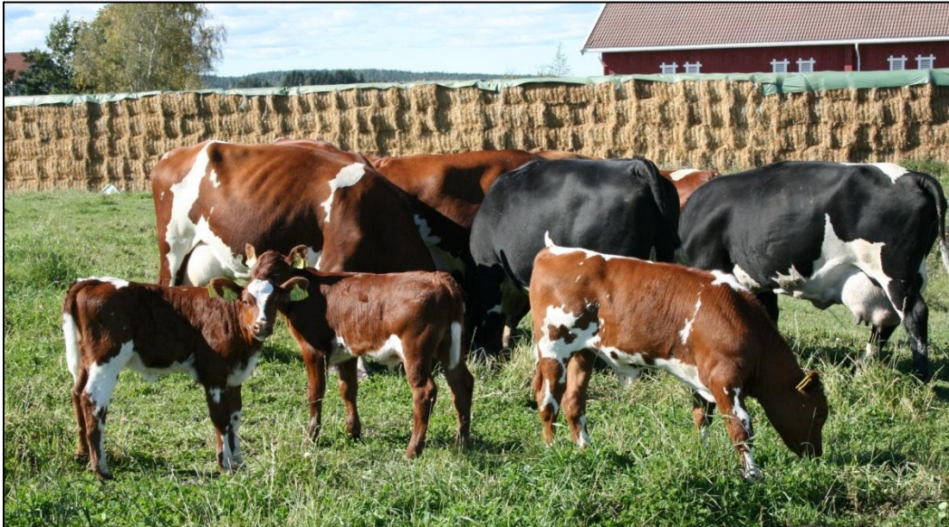
Fig. 4 Kalvene til Grøndahl går sammen med mora i 6-8 uker.

grenser mot kubeitet. Der kan ku og kalv se hverandre om ønskelig. Når kalvene drikker godt fra flaske får de etter hvert melk i smokkebøtte, ca 7 - 10 liter pr døgn helt til de blir slaktet. Kraftfôrtildelingen er sparsom ettersom kalvene får så store mengder melk.