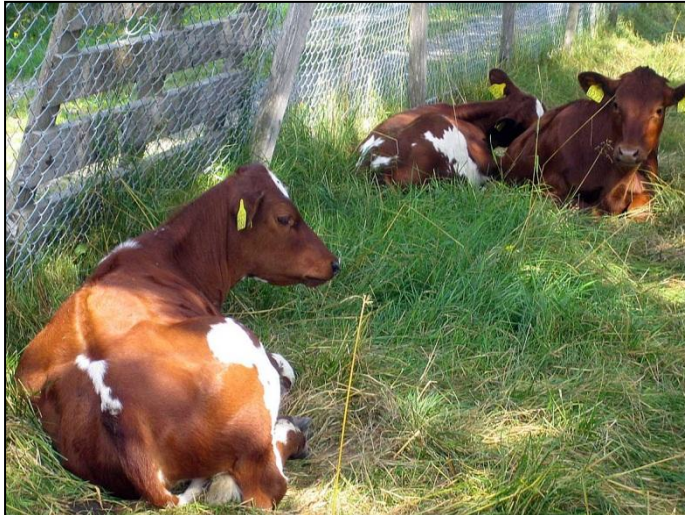
Fig. 5 Kalver på beite.