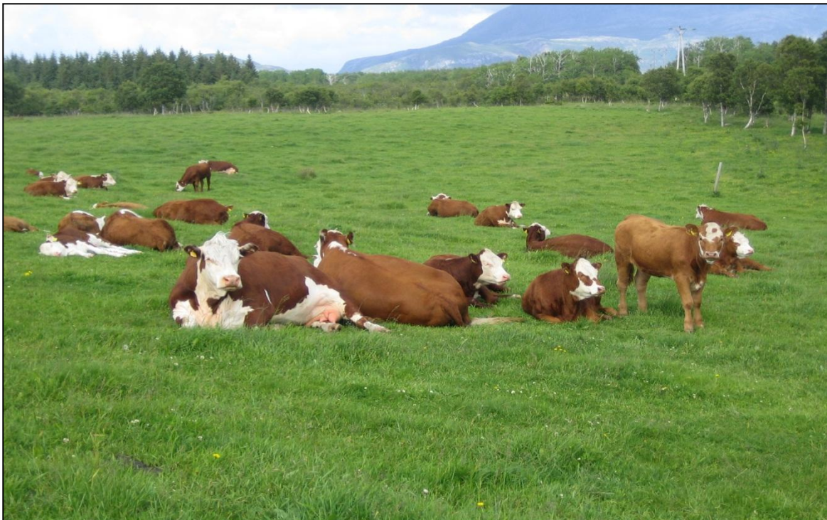
Fig. 3 Ammekyr med kalv på kulturbeite.

Tradisjonelt var storfe det viktigste husdyret når det gjaldt beitebasert kjøttproduksjon på utmarksbeiter. Ungdyra var i utmarka og melkekyrne var på setervollene. Endringer i dagens storfeproduksjon har ført til at fokuset nå er på melkeproduksjon, med store enheter og høy avdrått som hovedmål. Dette har ført til en nedgang i bruken av beiter og i produksjonen av storfekjøtt. Vi har fått en dreining i norsk matproduksjon fra å være basert på en ressurs det er mye av, grovfôr og beite, til en ressurs som må importeres, kraftfôr. Studier gjort i Irland og Sverige har vist at beitebasert kjøttproduksjon kan gi den samme tilveksten og kjøttkvaliteten som tradisjonell kjøttproduksjon basert på kraftfôr (French et al. , 2001, Ahnstrøm et al. , 2009). Storfe som i hovedsak spiser friskt beitegras har et høyere innhold av flerumettede fettsyrer (omega-3) i kjøtt og melk enn dyr på mer kraftfôrbaseret fôring (Woods & Fearon, 2009). Det er vist at beitebasert kjøttproduksjon gir kjøtt med et høyere innhold av umettede fettsyrer (omega-3) enn kjøttproduksjon basert på kraftfôr. Beitebasert kjøttproduksjon egner seg godt for både kastrater, kviger og kalver (fig. 3).