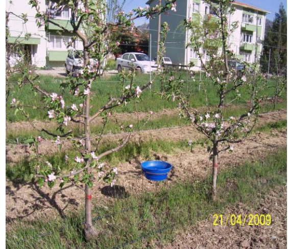
Şekil 4. Baklazınını mücadelesi

Yabancı ot ile mücadele yöntemleri: Sıra aralarındaki yabancı otlar toprak yüzeyinin 3-5 cm yukarisından yılda 2 kez traktöre bağlı ot biçme makinası ile biçilmiş; ağaç taç izdüşümündeki yabancı otlarda ise, yılda 1 kez el çapası kullanılmış, 2 kez de motorlu tırpan ile toprak yüzeyinin 3-5 cm yukarisından biçilmiştir.