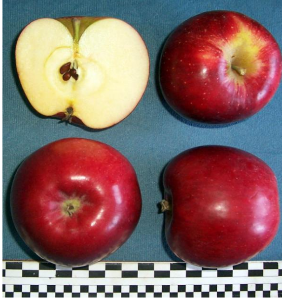
Şekil 5. Rajka elma çeşidi

Zirai Mücadele Uygulamaları: Hastalık ve zararlılarla mücadele, entegre zirai mücadele yöntemine göre yapılmıştır. Yabancı ot ile mücadele ise sıra araları organik parselde olduğu gibi yılda 2 kez traktöre bağlı ot biçme makinası ile biçilmiş, ağaç taç izdüşümündeki yabancı otlarla ise yılda 2 kez motorlu tırpan ile toprak yüzeyinin 3-5 cm yukarisından biçilerek, 2 kez de kimyasal ilaçlama yapılarak mücadele edilmiştir.