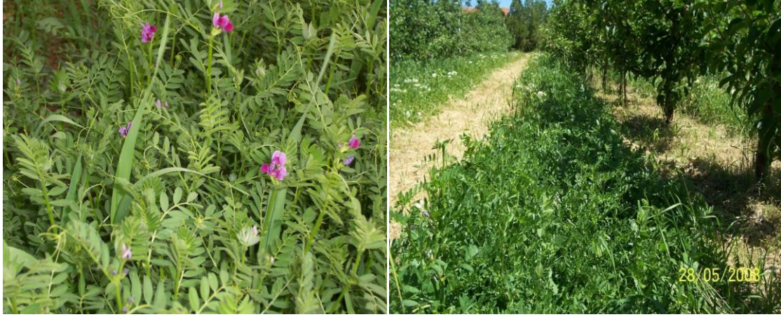
Şekil 2. Yeşil gübreleme

Zirai Mücadele Uygulamaları: Tüm kombinasyonlarda aynı olmak üzere aşağıda belirtilen hastalık, zararlı ve yabancı otların mücadelesinde 2002 ve 2005 yıllarında çıkartılan “Organik Tarımın Esasları ve Uygulanmasına İlişkin Yönetmeliğe” uygun yöntemler kullanılmıştır.