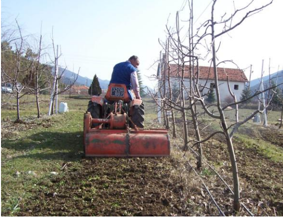
Şekil 1. M9 anaçlı elma bahçelerinde çiftlik gübresi uygulaması

Yeşil Gübreleme: Şubat-Mart aylarında ağaç taç iz düşümüne adi fiğ tohumu ekilmiş ve yaklaşık % 50 çiçeklenme döneminde toprağa karıştırılmıştır (Şekil 2).