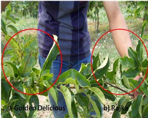
Şekil 3. Karaleke hastalığına hassas çeşit (a) ile dayanıklı çeşit (b)'in yaprakları

Baklazınını: Çiçeklenme döneminde su dolu mavi leğen uygulaması yapılmıştır (Şekil 4).