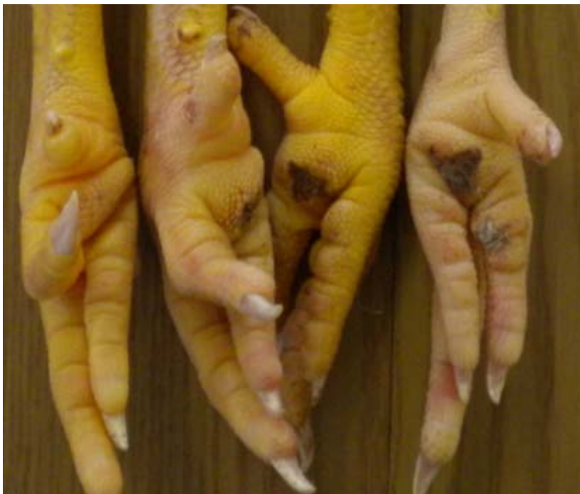
Abbildung 1: Beurteilungsschema für die Pododermatitis, modifiziert nach EKSTRAND et al. (1997) sowie BERG (1998) (von links nach rechts; Score 0: ohne Befund, Fußballen vollständig intakt; Score 1: geringgradig, oberflächliche Verschörfung des Epithels bis beginnende Hyperkeratose; Score 2: mittelgradig, Hyperkeratose bis oberflächliche Läsionen; Score 3: hochgradig, tief eingedrungene Läsionen, großflächige Hyperkeratose, Ulzerationen)