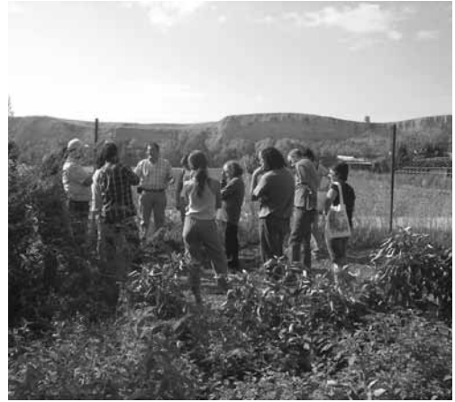
Ensayo visita de campo. III Encuentro interterritorial del proceso de SPG andaluz. Cooperativa la Acequia (Córdoba).

mucho, pero a la hora de comérselo es un bocado exquisito. No debe perderse. Yo creo que un noventa... más del noventa por ciento de la gente que siembra sus tomates siembra los de aquí. Por la calidad (P2)