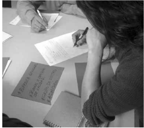
I Encuentro interterritorial del proceso de SPG andaluz. Santa Fe (Granada).