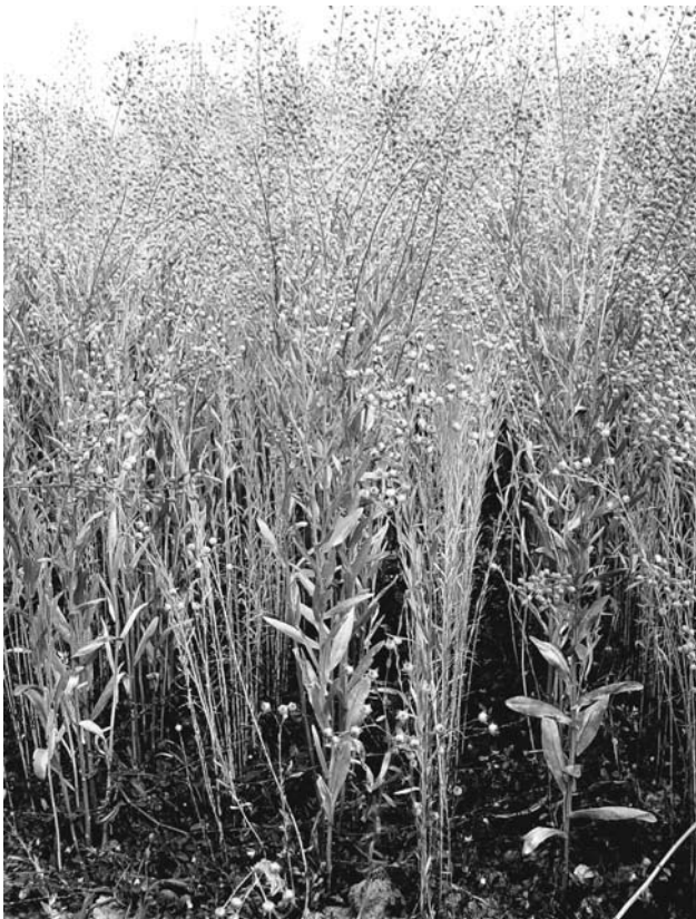
Abbildung 3: Mischfruchtanbau von Leindotter mit Lein, 12,5 cm Reihenabstand, Trenthorst 2005

In der Versuchsserie zur Variation der Saatmengen und Saatverfahren nahm der Leinertrag bei höheren Leindotteranteilen im Gemenge signifikant ab. Der höchste Leinanteil wurde bei Breitsaat des Leindotters erzielt. Die Tankmischung der Saaten brachte gegenüber der Saat in alternierenden Reihen und engem Reihenabstand keinen Ertragsnachteil. Auch eine Saat mit weiteren Reihenabständen verbesserte die Ertragsleistung des Leins im Mischfruchtanbau nicht (Abbildung 4). Die Gesamterträge des Mischfruchtanbaus unterschieden sich nicht statistisch signifikant von den Reinsaaterträgen des Leindotters. Bei normalen Leindotter- bzw. Leinerträgen in Reinsaat wurden überwiegend leicht erhöhte Flächenproduktivitäten des Mischfruchtanbaus gemessen am LER errechnet. Am Standort Pfaffenhofen, der in beiden Versuchsjahren eine erhebliche Verunkrautung mit Echter Kamille aufwies und an den Standorten Gülzow in 2004 und Wilmersdorf in 2005, auf denen in den genannten Jahren aufgrund einer lang anhaltenden Frühjahrstrockenheit nur eine geringe Pflanzenentwicklung möglich war, wurden im Mischfruchtanbau von jeweils einer oder auch beiden Komponenten ähnliche Erträge wie in der Reinsaat erreicht. Dadurch ergaben sich die zum Teil deutlich erhöhten LER-Werte (Tabelle 3).