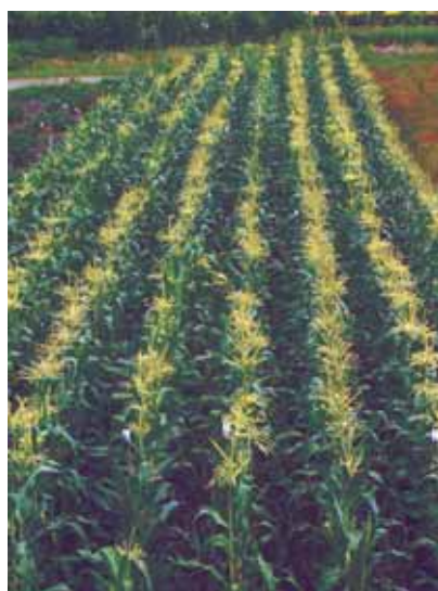
Vom Versuchsfeld auf den „Seziertisch“