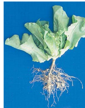
Oberirdische und unterirdische Befallssymptome von Meloidogyne hapla an Tomate (3), Möhre (4), Rote Beete (5) und Salat (6)