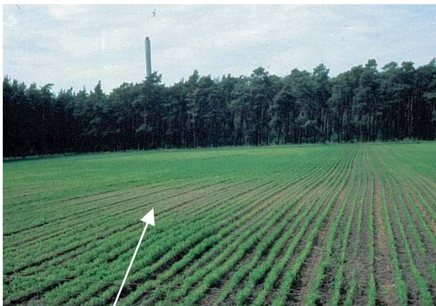
Befallsnest mit Meloidogyne hapla in Möhren (2)

Da M. hapla ausschließlich unterirdische Pflanzenorgane befällt, wird ein Befall häufig erst spät entdeckt. Aufgrund des breiten Wirtspflanzenspektrums und hohen Vermehrungspotenzials ist die Bekämpfung von M. hapla recht schwierig.