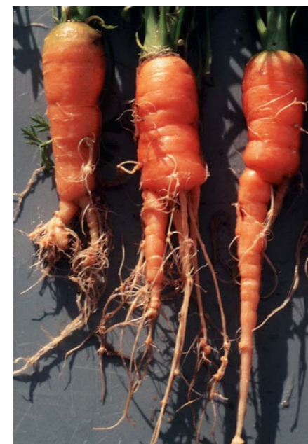
Schadbild von Meloidogyne hapla an Möhren

Dieses Informationsblatt möchte Landwirte und Berater über den Nördlichen Wurzelgallennematoden Meloidogyne hapla informieren. Dieser Nematode verursacht vor allem im ökologischen Landbau zunehmend Schäden an Gemüse und Kartoffeln. M. hapla ist die in Mitteleuropa am häufigsten vorkommende Meloidogyne -Art. Sie kann vor allem auf leichten Böden beträchtliche Schäden verursachen.