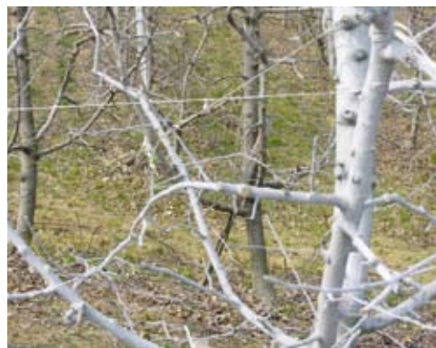
Fig. 1 - Pianta di melo trattata con caolino.

I tessuti vegetali ricoperti da questo film risultano irriconoscibili al tatto, alla vista e all'olfatto degli insetti, infatti il principale meccanismo d'azione del caolino è la repellenza nei confronti degli adulti con riduzione dell'attività trofica e dell'ovideposizione. Inoltre, il movimento degli insetti, l'attività trofica e altre attività fisiche, quali l'ancoraggio al vegetale, possono venire gravemente compromesse per l'adesione delle particelle di caolino al corpo degli insetti stessi, quando questi