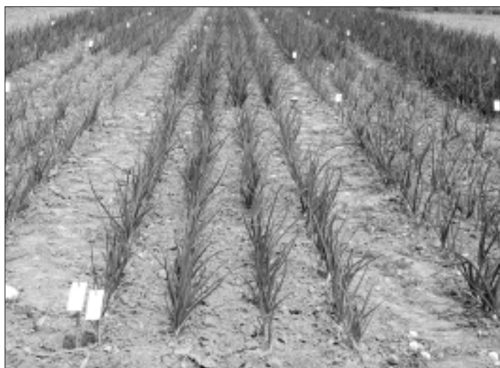
Fig. 2. Vue d'ensemble des essais en avril 2003: les oignons de la variété Radar en culture PI. Des différences marquées du développement ont été observées d'après le calibre des oignons à repiquer et les séries.

R. Theiler, Hp. Buser, U. Ingold, P. Schätti et M. Humi, Station fédérale de recherches (FAW), CH-8820 Wädenswil, Martin Koller, Institut de recherches en agriculture biologique, CH-5070 Frick, Courriel: robert.theiler@faw.admin.ch