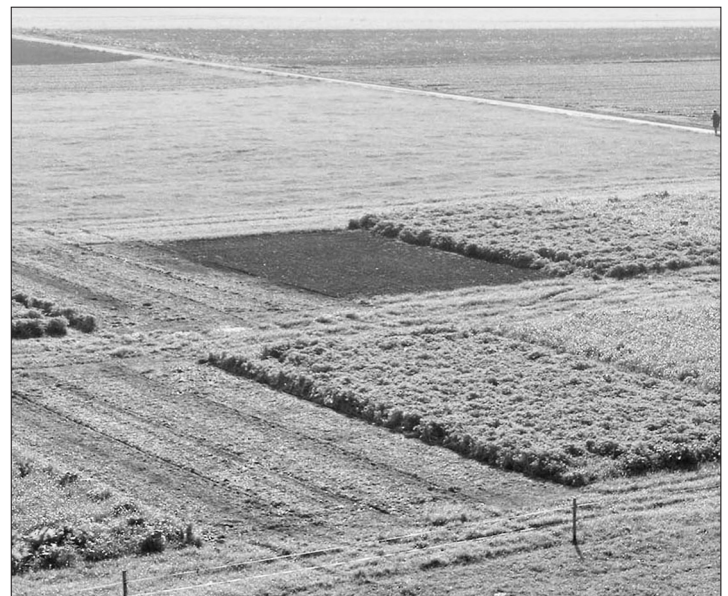
Abb. 1. Winterbegrünungen im Vergleich. Blick auf das Feld mit den Versuchspartellen.

Interessant war der Ertrag in der Phacelia-Klee-Variante. Hier war der Ertrag um 18% höher als in der ungedüngten Winterbrache. Dies kann auf die deutlich geringere N-Auswaschung zurückgeführt werden. Denn Mitte Oktober war der N_{min} -Gehalt des Bodens in dieser Variante am niedrigsten, der N-Gehalt in der Grünmasse