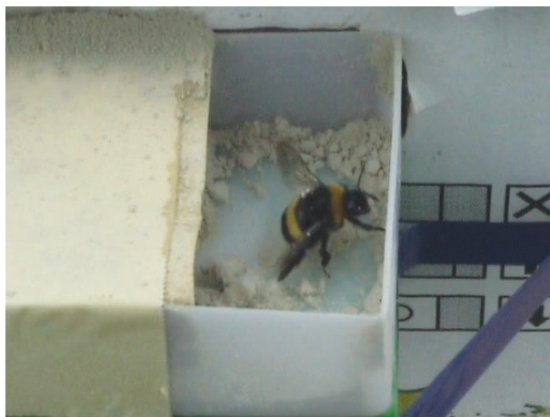
Fig. 6 - Nella sequenza un bombo si imbratta di T. harzianum prima di spiccare il volo