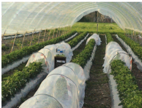
Fig. 2 - Coperture con reti anti-insetto nel tunnel oggetto della sperimentazione

L'impiego congiunto di microrganismi utili e d'insetti pronubi come loro vettori richiede quindi ulteriori approfondimenti ma offre interessanti prospettive, considerando i risultati ottenuti nel 2002 e soprattutto le dosi ridotte d'impiego, inferiori anche di 4 volte rispetto alla somministrazione diretta.