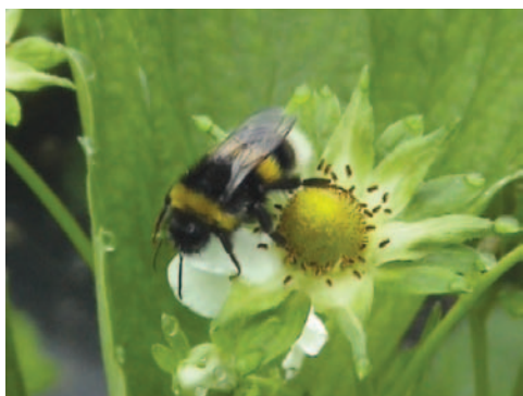
Fig. 4 - Bombo su fiore di fragola