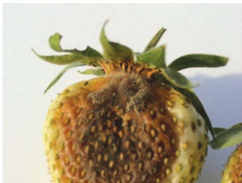
Fig. 5 - Infezione di B. cinerea su fragola immatura