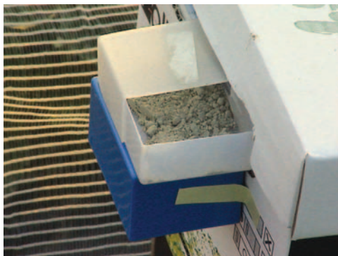
Fig. 3 - Dispenser di T. harzianum ottenuto con un semplice contenitore per diapositive