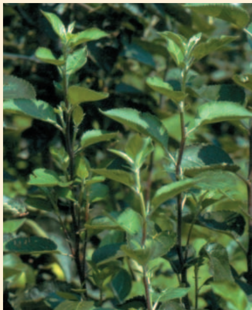
Fig.4 - Emissione incontrollata di germogli laterali sui rami dell'anno (scopazzi)