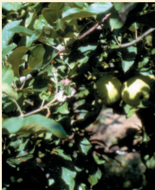
Fig.6 - Fioriture fuori stagione