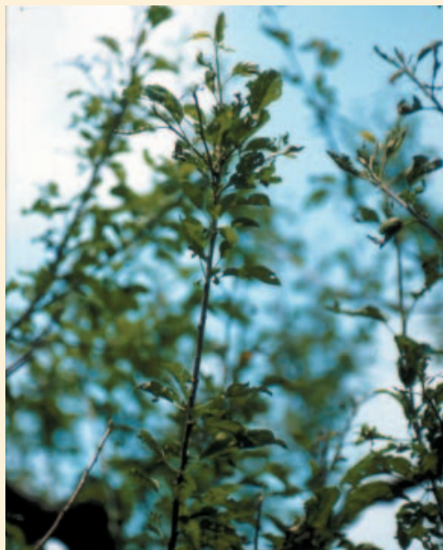
Fig.5 - Formazione di rosette di foglie all'apice dei germogli