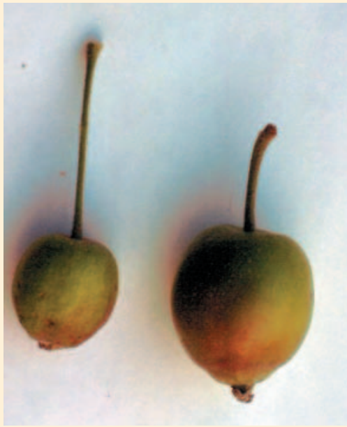
Fig.8 - Frutti di dimensioni inferiori con picciolo allungato