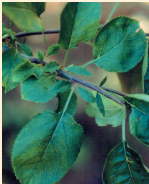
Fig.7 - Stipole di dimensioni superiori alla norma