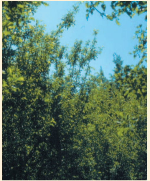
Fig.9 - Affastellamento vegetativo dell'intera pianta