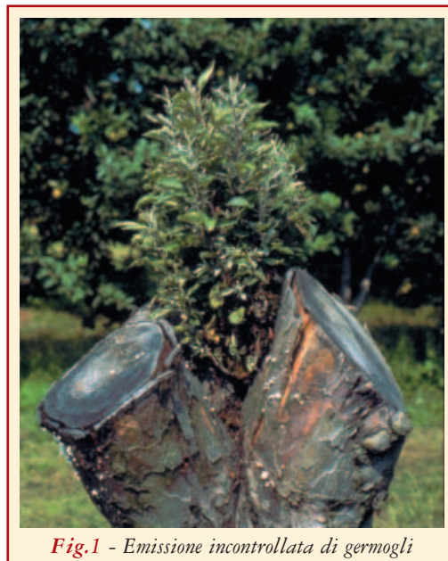
Fig.1 - Emissione incontrollata di germogli

Il fitoplasma può essere trasmesso attraverso materiale di propagazione infetto (innesto), anastomosi radicale e tramite punture di suzione di insetti vettori appartenenti all'ordine dei Rincoti. I vettori dell'AP accertati in Italia sono le psille Cacopsylla costalis (Flor) e Cacopsylla melanoneura (Förster).