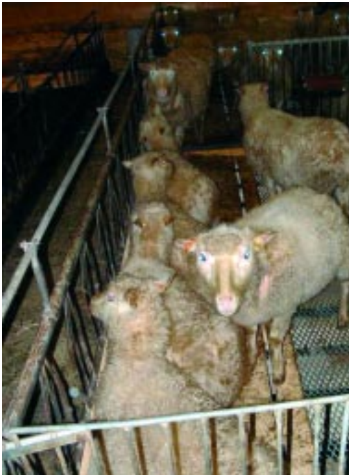
Sauer som ligger på liggepall.

To ulike utforminger av liggeareal i eksisterende bygninger har blitt utprøvd på tre Vestlandsgårder. Liggearealet var utformet med henholdsvis liggepall foran og bak i bingen, og u-forma liggepall i bakkant av bingen.