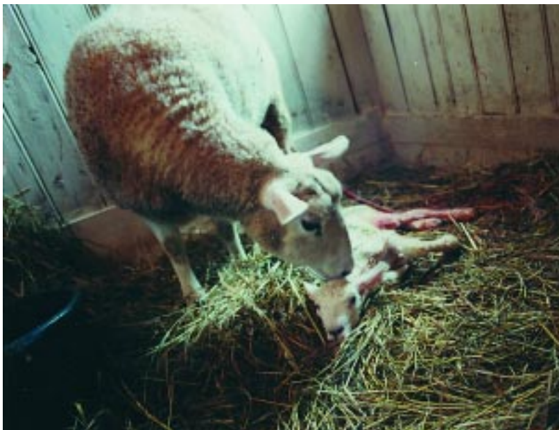
Det viktigste tiltaket for å forbygge sykdom hos lam er å sikre at de får en skikkelig dose råmelk ved fødsel (innen to-fire timer!)

For å kartlegge gode og svake sider med beiteopplegget sitt bør en følge med vekta på lamma. En bør veie en gruppe av flokken ved lamming (fødselsvekt), ved beiteslipp