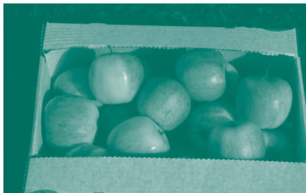
Eple av tidligsorten 'Nanna' fra ett av forsøksfeltene.

Resultat fra prøvingen er vist i tabell 1. 'Aroma Ylvisåker' var den desidert mest produktive sorten. Resultatene vi presenterer er fra etableringsfasen, slik at avlingsnivåene ennå er lave. Vi fant en del skurv på 'Aroma', 'Nanna' og 'Rød Ingrid Marie' i feltet hos en av dyrkerne i 2001. Det var svært vanskelig å kontrollere skurven denne sesongen på grunn av lengre sammenhengende fuktperioder vår og forsommer. Dette feltet ligger dessuten slik til at det tørker sent opp, og det ble ikke tilstrekkelig fulgt opp med sprøyting med svovelpreparat. Vilkårene for skurvinfeksjon var derfor svært gode. I 2001 hadde 'Aroma' i dette feltet mer skurv på bladene enn 'Nanna', noe som samsvarer med resultat fra de andre feltene og fra andre forsøk med disse to sortene. Alle sortene i prøvingen er så sterke mot skurv at denne syk-