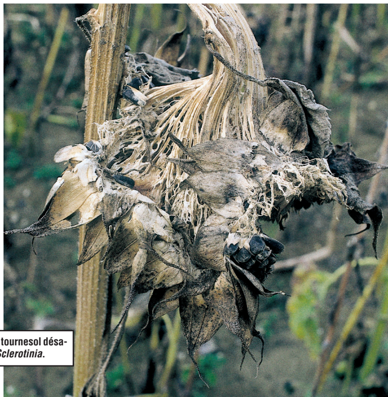
Capitule de tournesol désagrégé par Sclerotinia .

Tout d'abord, il faut essayer de limiter la succession de cultures sensibles au Sclerotinia sur la même parcelle : le nombre de sclérotés dans le sol augmente en effet à chaque nouvelle rotation. La polyphagie du champignon ne permet pas de jouer pleinement sur la rotation culturale. Seules les céréales et les alliées permettent de casser le cycle... Pour le tournesol notamment, il faut veiller à la qualité de la semence.