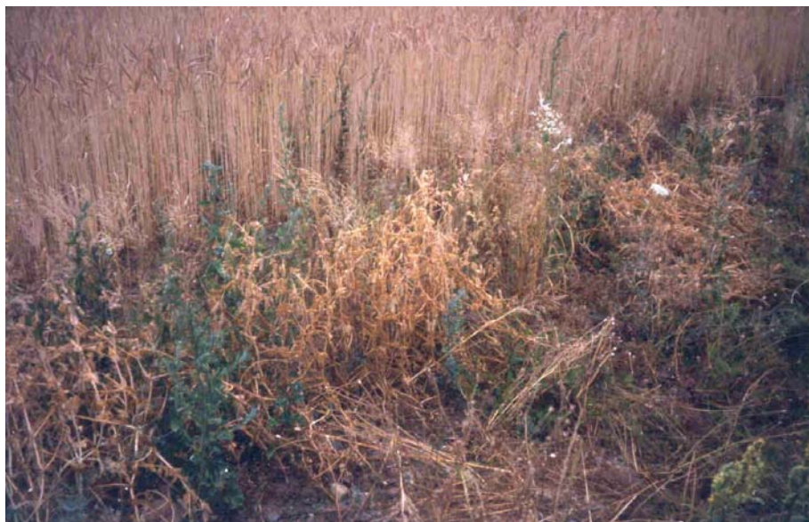
Abb. 1: Winter-Erbse "Assas" beim Betrieb Ehrler (Betrieb Nr. 16)