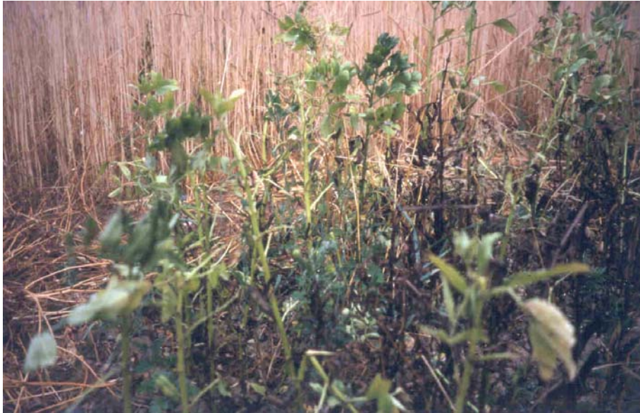
Abb. 3: Winter-Ackerbohne "Göttinger Population" beim Betrieb Ehrler vor der Ernte (Betrieb Nr. 16)