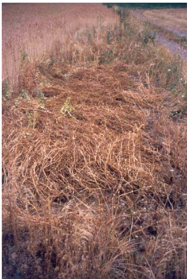
Abb 2: Winter-Erbse "EFB 33" ohne Stützfrucht beim Betrieb Ehrler (Betrieb Nr. 16)