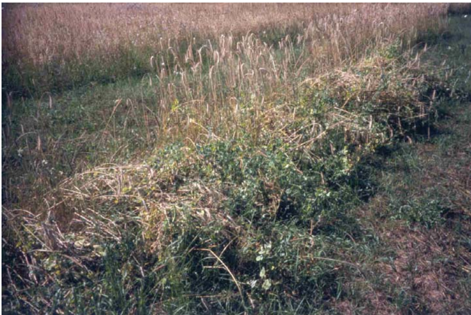
Abb. 6: Winter-Erbse "EFB 33" mit Stützfrucht Winter-Roggen beim Betrieb Vogt (Betrieb Nr. 11)