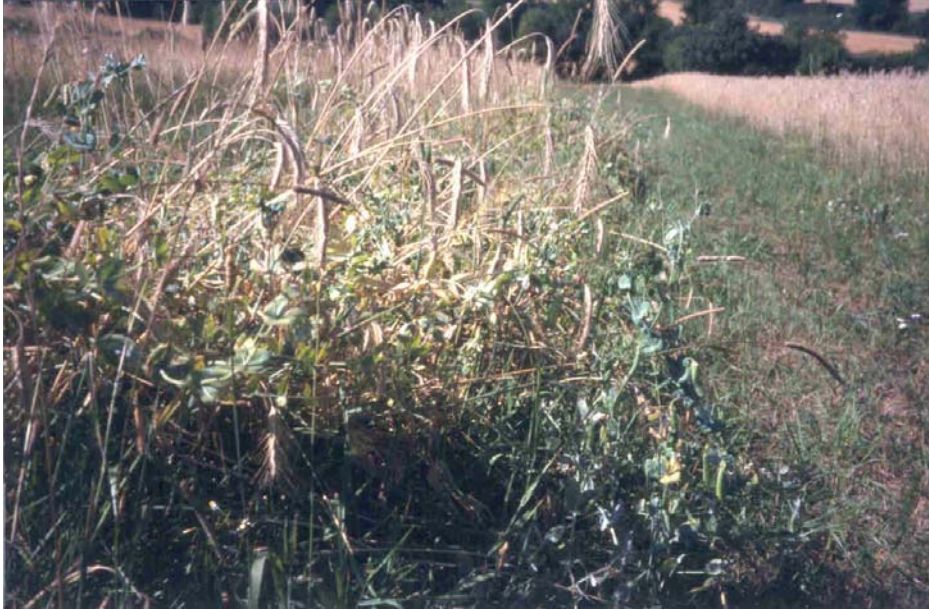
Abb. 5: Winter-Erbse "EFB 33" mit Stützfrucht Winter-Roggen beim Betrieb Vogt (Betrieb Nr. 11)