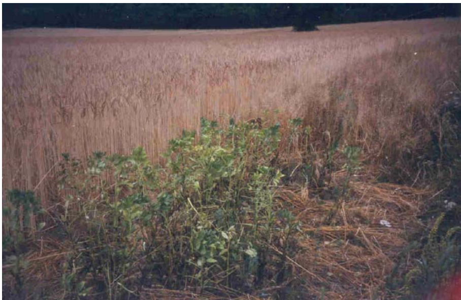
Abb. 3: Winter-Ackerbohne "Göttinger Population" beim Betrieb Ehrler vor der Ernte (Betrieb Nr. 16)