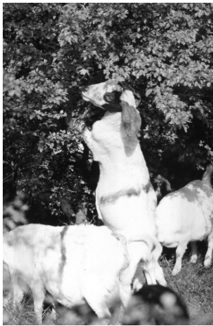
Abb. 1: Den Verbiss für die Entbuschung nutzen: Magerrasenpflege durch Ziegenbeweidung.

aus südlicheren Gebieten nach Mitteleuropa eingewandert – ohne entsprechende Bewirtschaftung verschwinden sie wieder. Eines zentralen Pflegeproblem auf Halbtrockenrasen ist die natürliche Wiederbewaldung nach Aufgabe der Bewirtschaftung. Nach dem Bundesnaturschutzgesetz