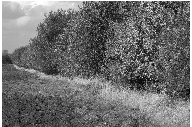
Abb. 3: Eine Hecke am Feldrand bietet vielseitigen Nutzen.

Als Maßstab des Naturschutzes diente früher häufig die „potenziell natürliche Vegetation“ – ein Konstrukt, bei dem als Leitbild die Vegetation zu Grunde gelegt wird, die sich spontan einstellen würde, „wenn der Einfluss des Menschen entfiel“. Der Mensch gilt als Störfaktor, vor dem die Natur geschützt werden muss. Andere Naturschutzbestrebungen erkennen die positive Wirkung der historischen Landbewirtschaftung auf die biologische Vielfalt an. Die handarbeitsintensive vorindustrielle Kulturlandschaft wird dabei zum Leitbild verklärt. Aber zu Handtuchfeldern in der Realernte-landschaft gehörte auch ein anderer sozialer und gesellschaftlicher Rahmen – abgesehen davon, dass manche historische Form der Landnutzung alles andere als „nachhaltig“ gewesen ist. Doch auch im Naturschutz hat sich das Leitbild geändert. Der Naturschutzbund (NABU) betonte mit seiner Kampagne „Landschaft schmeckt“, dass jeder Verbraucher durch seine Kaufentscheidung mitbestimmt, wie „naturschonend“ Landwirte ihre Kulturlandschaft bewirtschaften können.