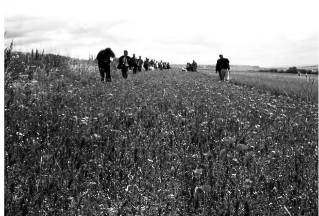
Abb. 2: Ungespritzter Ackerrandstreifen.

Alle Untersuchungen im In- und Ausland dokumentieren eine meist zwei- bis dreifach höhere Anzahl an Segetalarten bei ökologischer im Vergleich zu konventioneller Bewirtschaftung (van Elsen, 1996). Ursachen dafür sind der Ersatz chemischer durch mechanische Unkrautbekämpfung, vielfältigere Frucht-