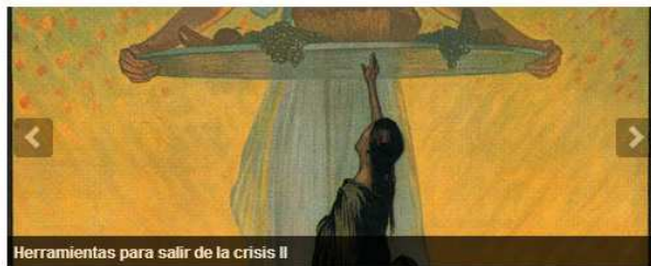
Herramientas para salir de la crisis II