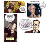
Workshop en Lógica y Filosofía de la Ciencia en Salamanca