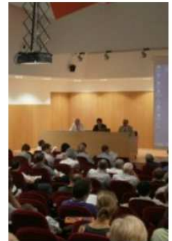
Sesión de apertura del Logic Colloquium 2011

Más de doscientos especialistas en diversas áreas de la lógica se dieron cita en las aulas de la Facultad de Filosofía de la Universidad de Barcelona durante los seis intensos días que duró el congreso.