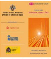
Jornadas sobre tecnología, valores y ética