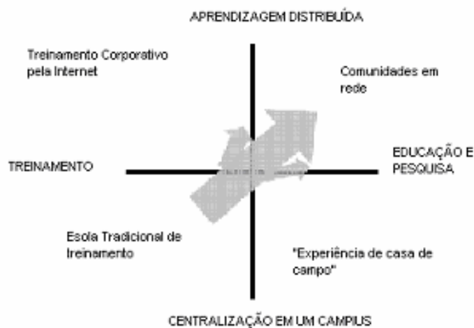
Fig.2 Tipologia das UCs

Combinando essas duas dimensões destacam-se 4 diferentes tipos de UCs. Ilustradas na Fig.2, indicando qual a modalidade de resultado que se pode esperar de cada tipo.