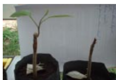
Figura 10. Mudanças com e sem brotos.