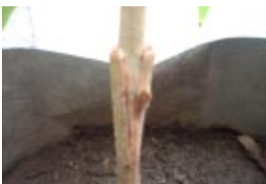
Figura 11. Detalhe da região enxertada.