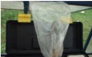
Figura 7. Saco plástico para a formação de câmara úmida no conjunto enxerto / porta-enxerto.