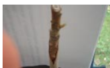
Figura 8. Tecidos enxerto (mini-garfo) e porta-enxerto consolidados.