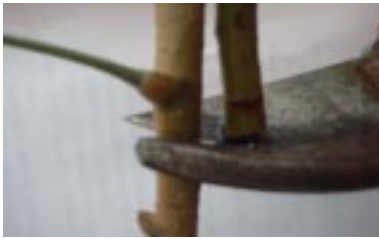
Figura 1. Secção transversal para retirada do mini-garfo