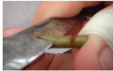
Figura 2. Corte em bisel para a formação do mini-garfo.