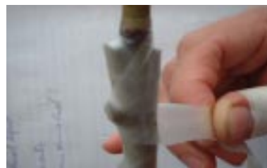
Figura 6. Armário do mini-garfo enxertado.