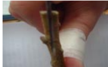
Figura 4. Corte no porta-enxerto para a inserção do mini-garfo.