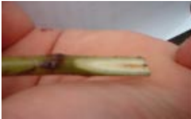
Figura 3. Mini-garfo cortado em bisel pronto para a enxertia