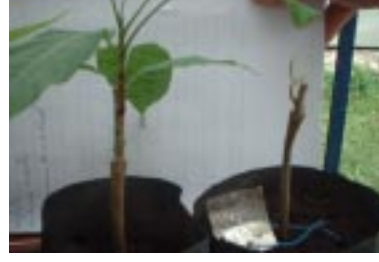
Figura 12. Mudanças com folhas e brotos.