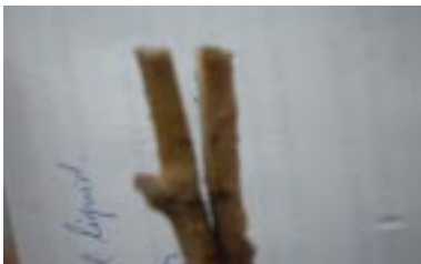
Figura 5. Porta-enxerto apto a receber o mini-garfo.